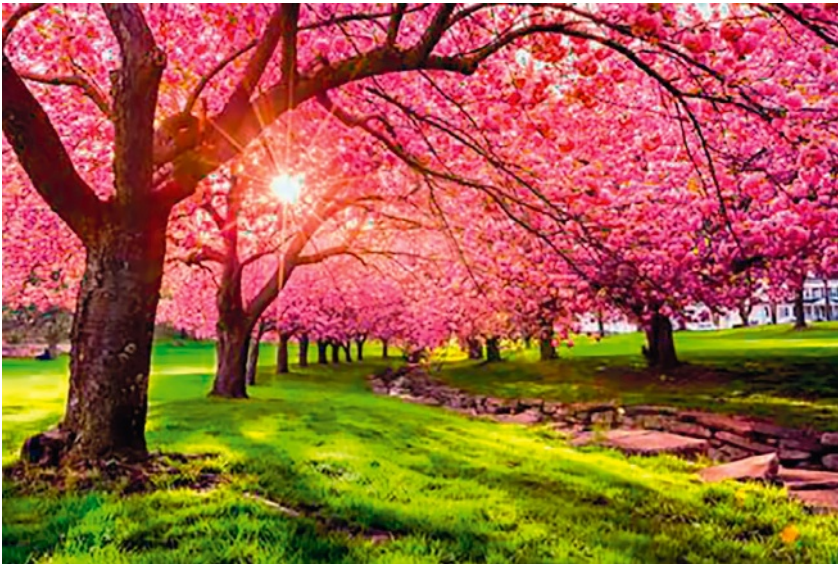
La lumière, le printemps qui arrive.