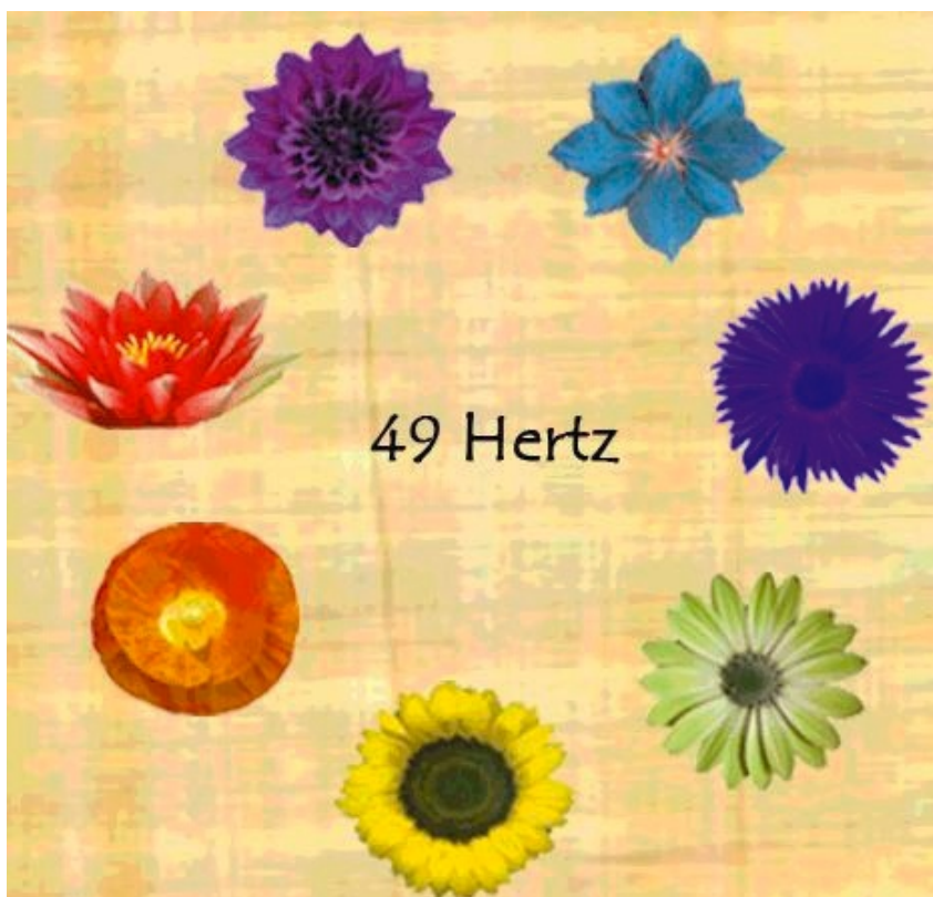
Le logiciel L.E.M.Q. Peau Soyeuse.

Une solution efficace et simple d'utilisation existe : la Chromo-Luminothérapie Musicale Quantique.